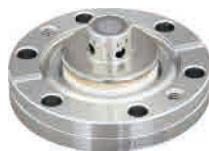
NJK2221A / NJK2321A